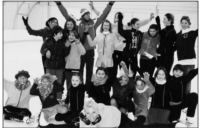
Gli allievi della Fortitudo Ghiaccio con il maestro.

E chissà che, da queste premesse, nascano risvolti positivi fino a poter giungere alla realizzazione di una struttura stabile e