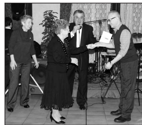
La consegna dell'assegno della BCC alla Coop. La Sorgente.

cuore le autrici del libro, la Banca e tutti coloro che sostengono le iniziative della Cooperativa.