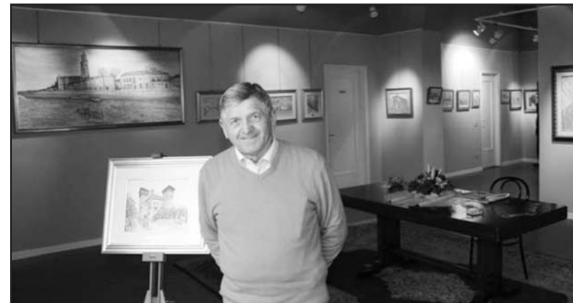
Giuseppe Bellini in mostra alla Galleria Civica.

La Galleria rimarrà aperta tutti i giorni dalle ore 9 alle ore 11,30 e dalle ore 15 alle 19.